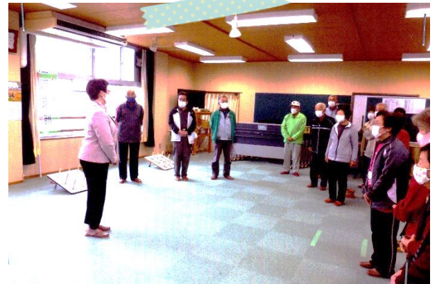
令和2年11月30日軽スポーツ大会の写真