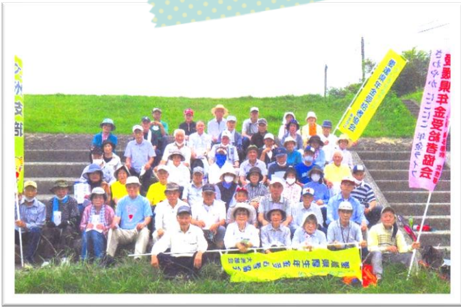
【令和3年7月5日グラウンドゴルフ大会の写真📷】

愛媛県に【まん延防止等重点措置】以上が発令された場合は行事が中止となります。 ※その際、お申し込みいただいた方へ個別に行事中止のご連絡はいたしませんのであらかじめご了承ください。