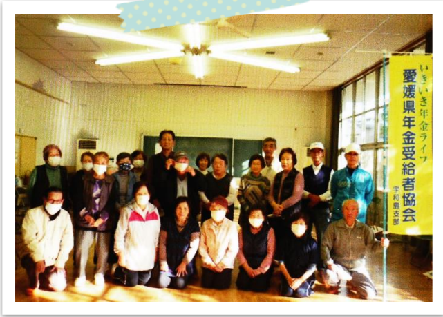
【令和2年9月11日輪投げ大会の写真📷】

後期に予定しております行事につきましては、状況を把握しながら引き続き感染対策を行い、楽しい行事を行って参ります！皆様のご参加をお待ちしております！😊